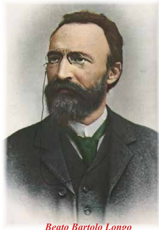
Beato Bartolo Longo

Uma nova vida, ao serviço da Virgem, começa para ele. Ele reza o terço todos os dias. Bartolomeu entrou na Terceira Ordem de São Domingos com o nome de «Irmão Rosário». Ele tem 31 anos.