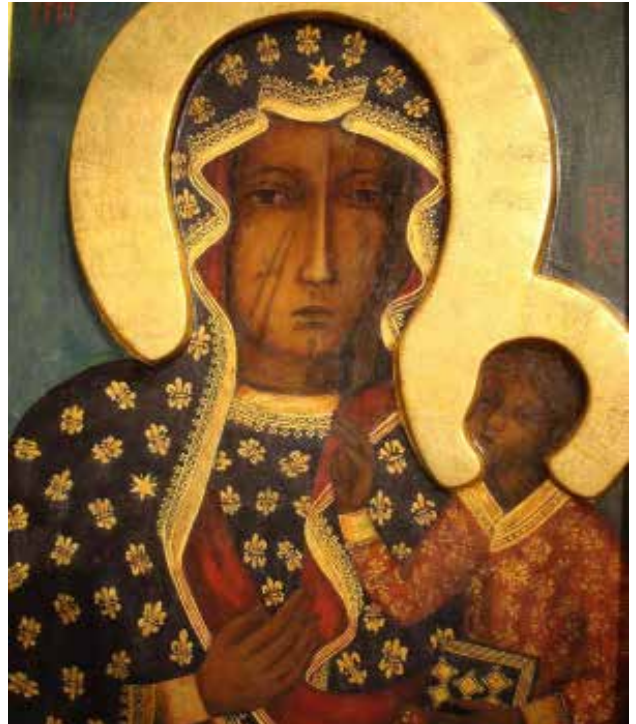
Nossa Senhora de Czestochowa. Padroeira de Polónia, terra natal de São João Paulo II

A dignidade fundamental de Maria é a de ser a Mãe do Filho, que se expressa na doutrina