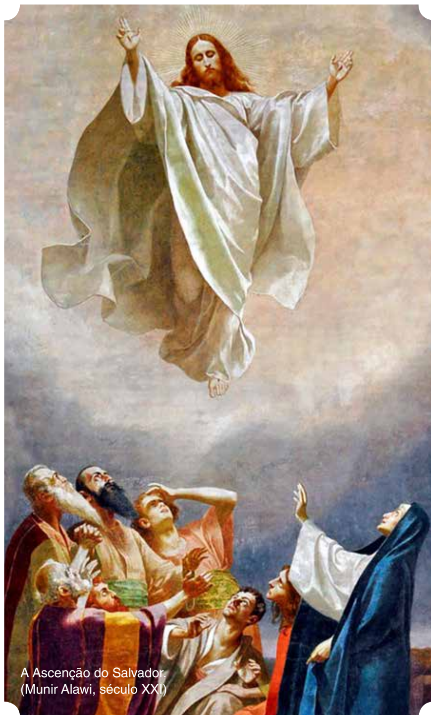
A Ascensão do Salvador. (Munir Alawi, século XXI)

Como os apóstolos então, Maria ajuda-nos a alcançar o céu, a não temer nenhum mal, qualquer que seja a adversidade que nos oprima, a recordar que nem a dor, nem a doença, nem