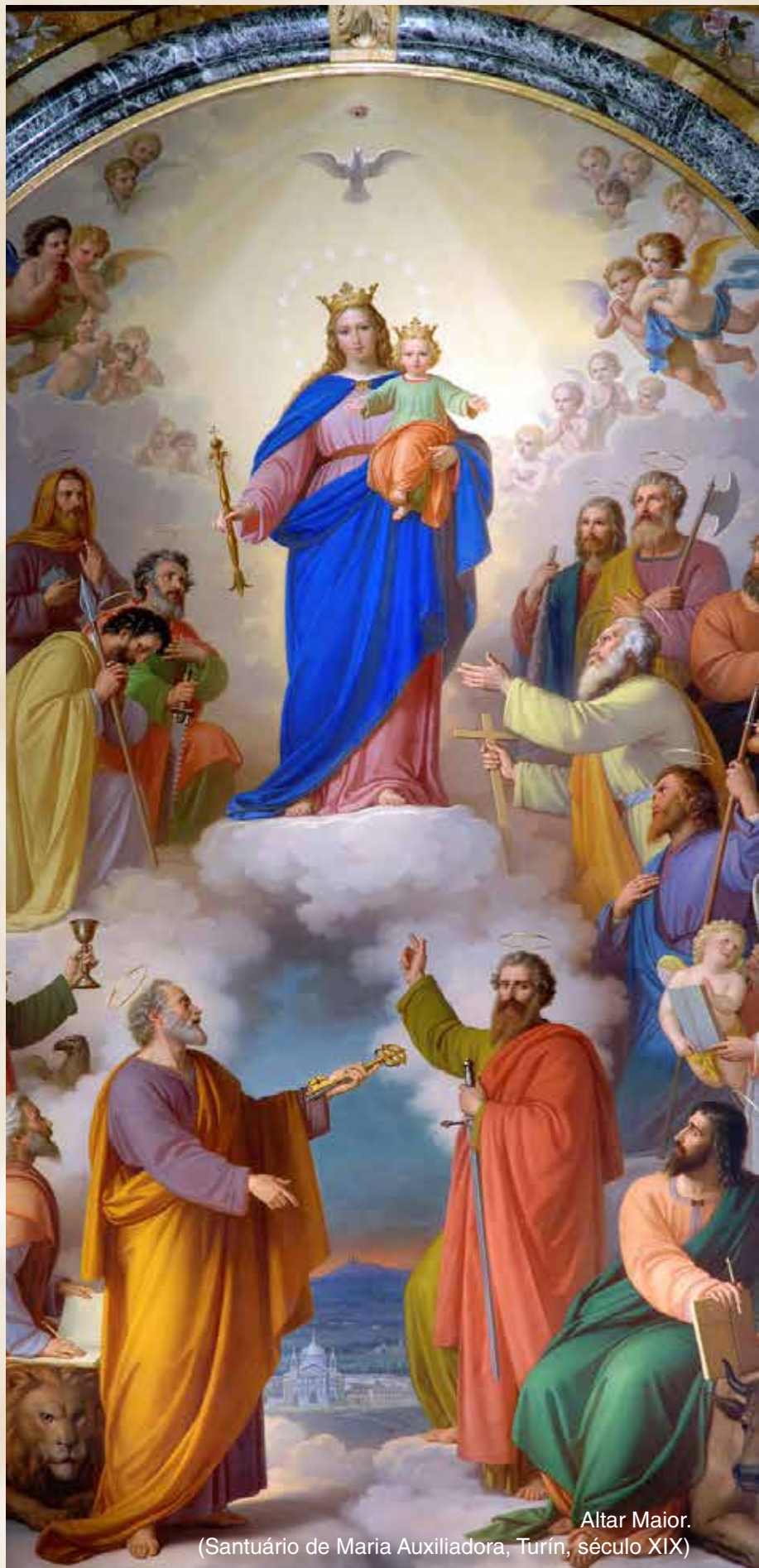
Altar Maior. (Santuário de Maria Auxiliadora, Turim, século XIX)